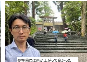
参拝前には雨が上がって良かった