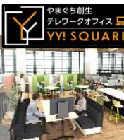
仕事しているフリの自分。防疫対応の立派なブース。こんな雰囲気(HPから画像流用)