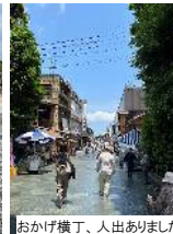
おかげ横丁、人出がありました