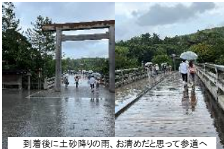
到着後に土砂降りの雨、お清めだと思って参道へ

不思議な繋がりや紹介などがあり伊勢でお仕事させて頂いている。広島には厳島神社(宮島)があり、こちらには伊勢神宮という日本を代表する観光スポット。コロナ禍からの回復に向かう様子も見たいと思い伊勢神宮を参拝してきた。思ったよりも車も多く、修学旅行生を多く見かけたが、コロナ前の半分くらいの人出だと地元の方が言っていた。やはり今まで通りにならない、戻らない部分は有るはずだから、今後を想定して事業を見直すことは、引き続き大事だなと。