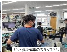
ガット張り作業のスタッフさん