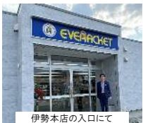
伊勢本店の入口にて

現在、効率化された店舗経営、ガット張り等のサービス提供の仕組み、ネット販売のノウハウをまとめたシステムを独自に構築してきましたが、今回は、システム開発の取り組みを支援しました。そして、現在は「支援サービス」として始められ、取り組みが遅れているラケットスポーツ全般の業界のレベルアップに繋げたいとの目標を持られています。スポーツ系の店舗関係者様、繋がってくださいませ。