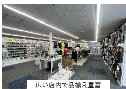
広い店内で品揃え豊富