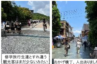
修学旅行生達とすれ違う観光客はまだ少ないみたい